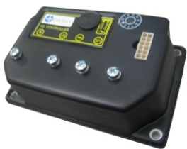
Versione con Trimmer Version with trimmer setting