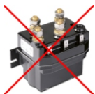
Funziona senza teleruttori No contactors required