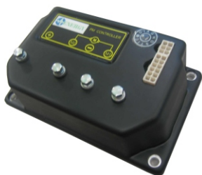
Versione con Calibratore Version with digital calibrator

4 quadrants contactorless system Regenerative braking